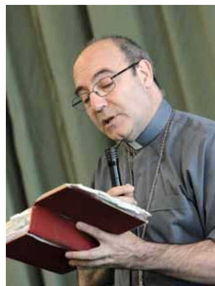
Mons. Felice Accrocca, Arcivescovo di Benevento

possa dare a tutti noi sempre maggiore consapevolezza della bellezza della vita fraterna.