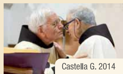
Castella G. 2014