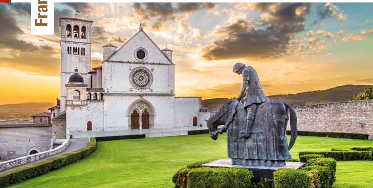
Basilica di San Francesco - Assisi