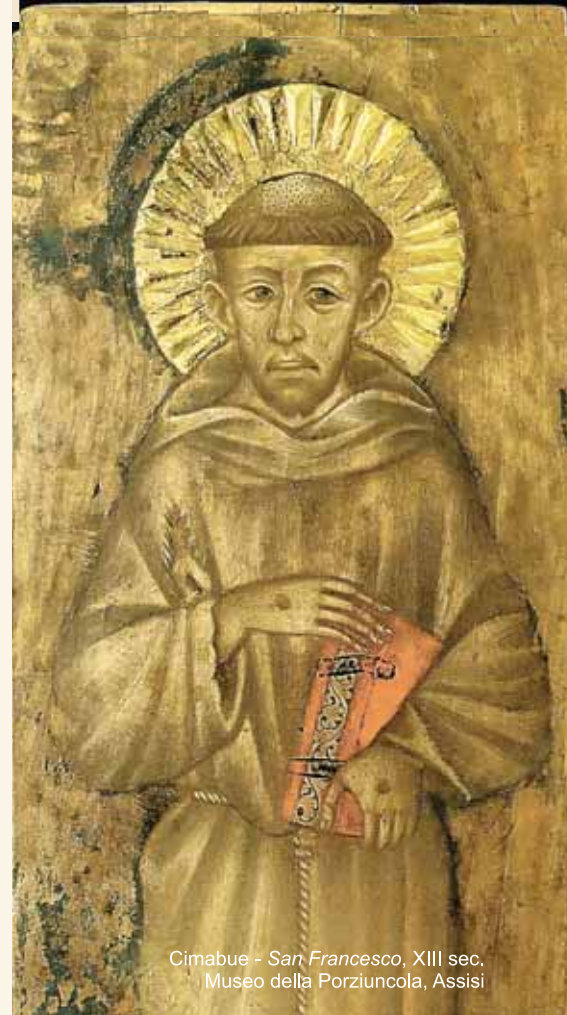
Cimabue - San Francesco, XIII sec. Museo della Porziuncola, Assisi

Francesco è stato raggiunto, conquistato da un amore più grande, per il quale vale la pena relativizzare tutto il resto (ricchezza, potere, affetti, glorie).